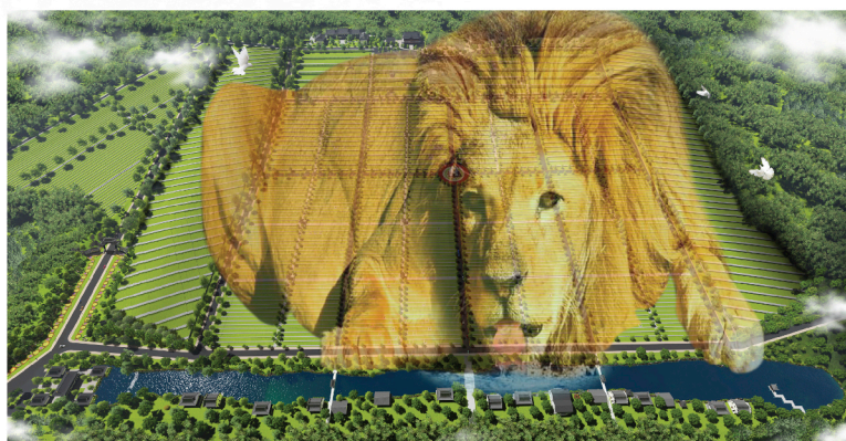
●富貴山莊(巴生)被喝名為“金獅探水穴”